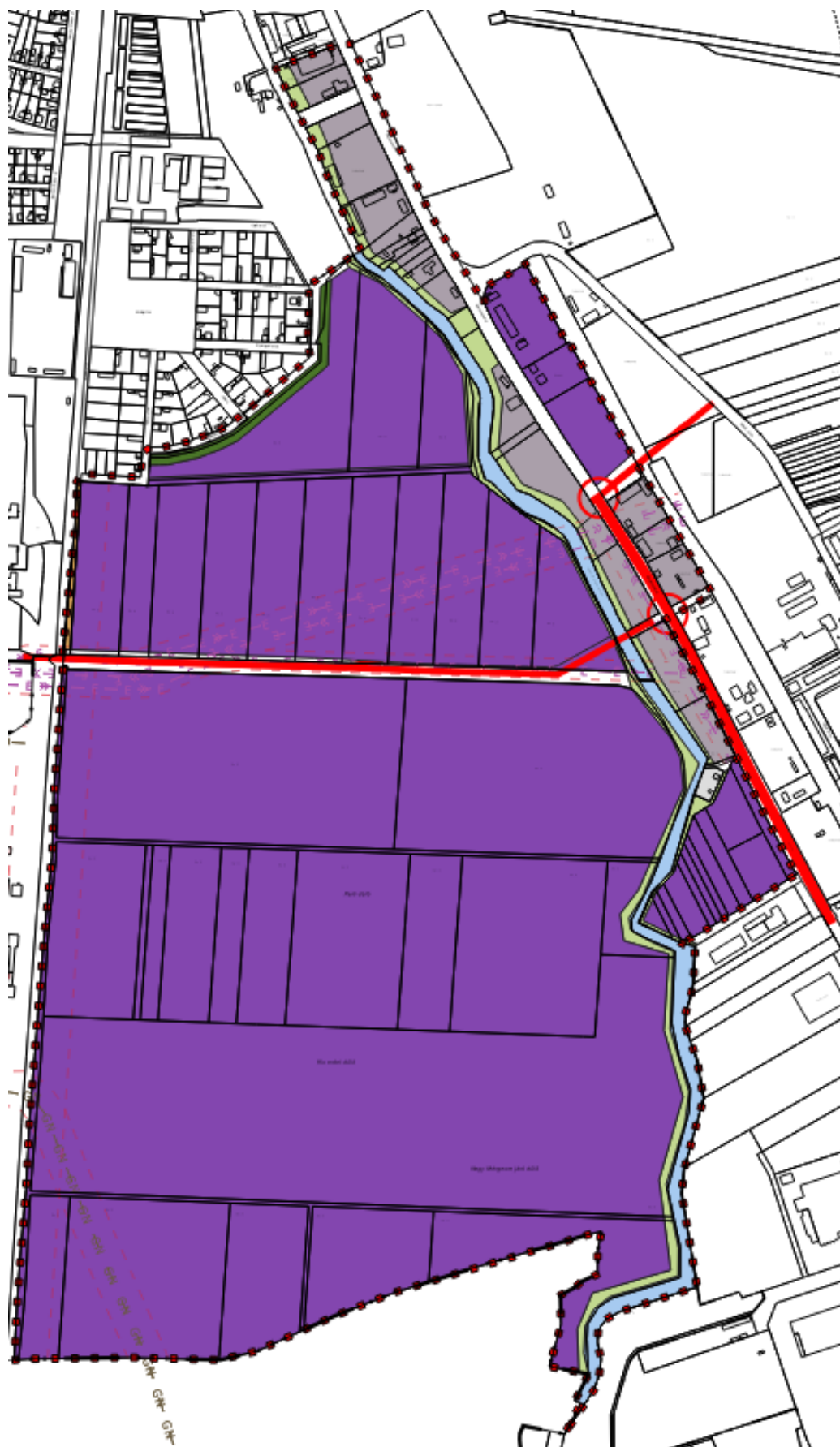
Tervezett településszerkezeti terv részlet - 1. tervezési terület