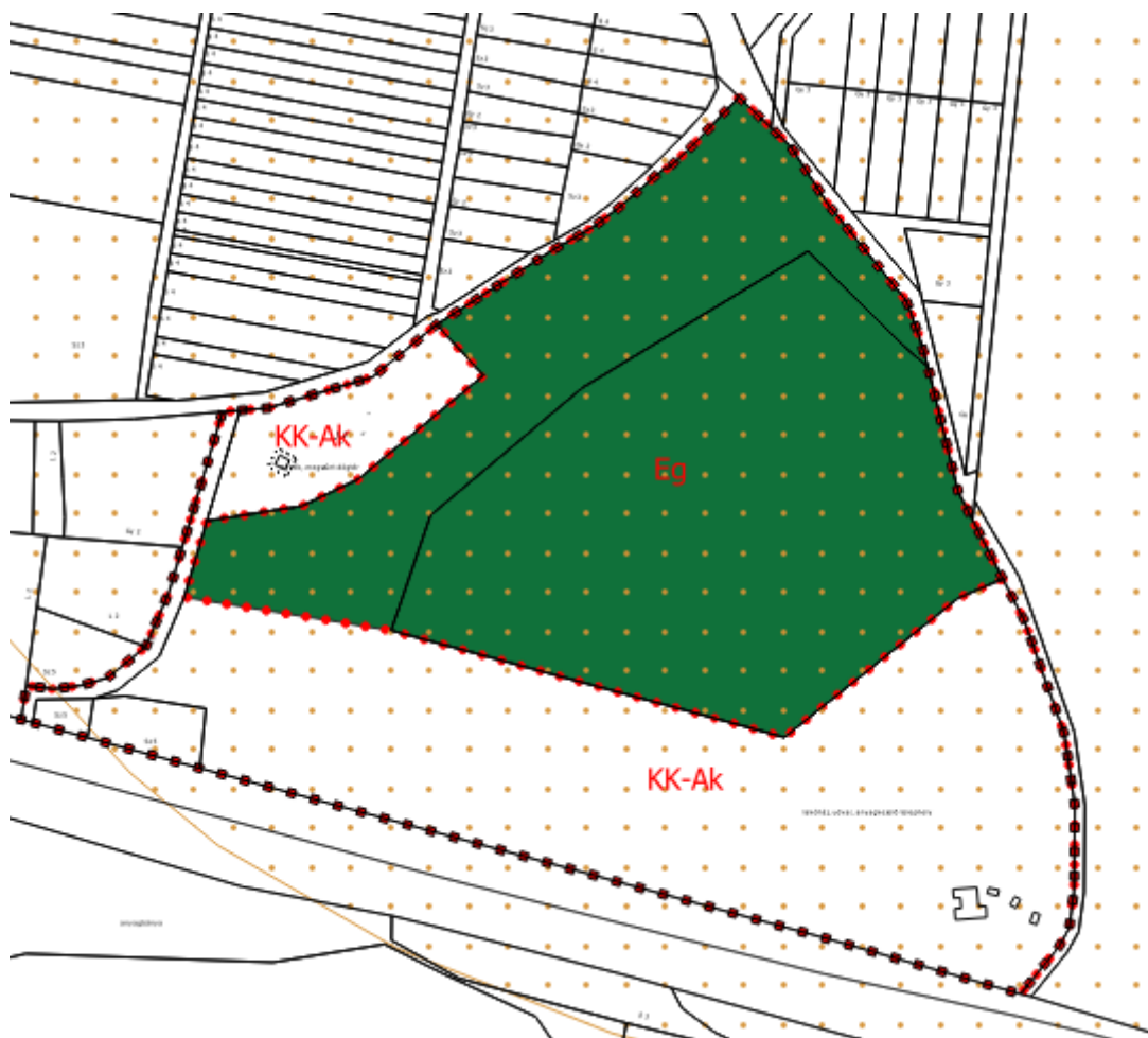
Tervezett szabályozási terv részlet - 2. tervezési terület